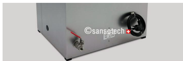
Ablauf mit Edelstahl Kugelhahn G½"