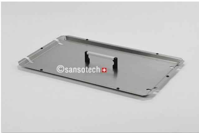
Wannendeckel (Edelstahl) Artikel-Nr. DLSW45H