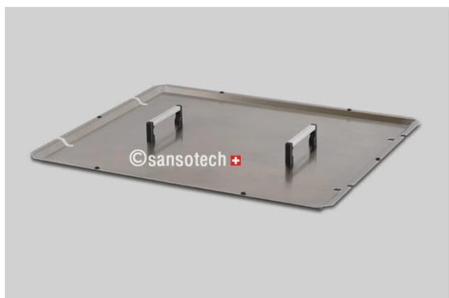
Wannendeckel (Edelstahl) Artikel-Nr. DLSW90H